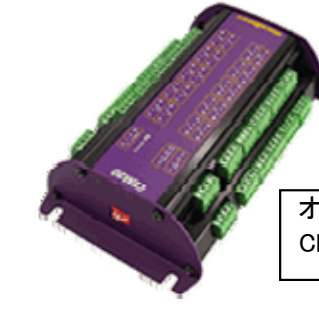
オプション拡張ユニット CEM20(20ch)