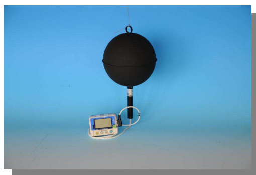
ロガー付グローブ温度計 PGT-02